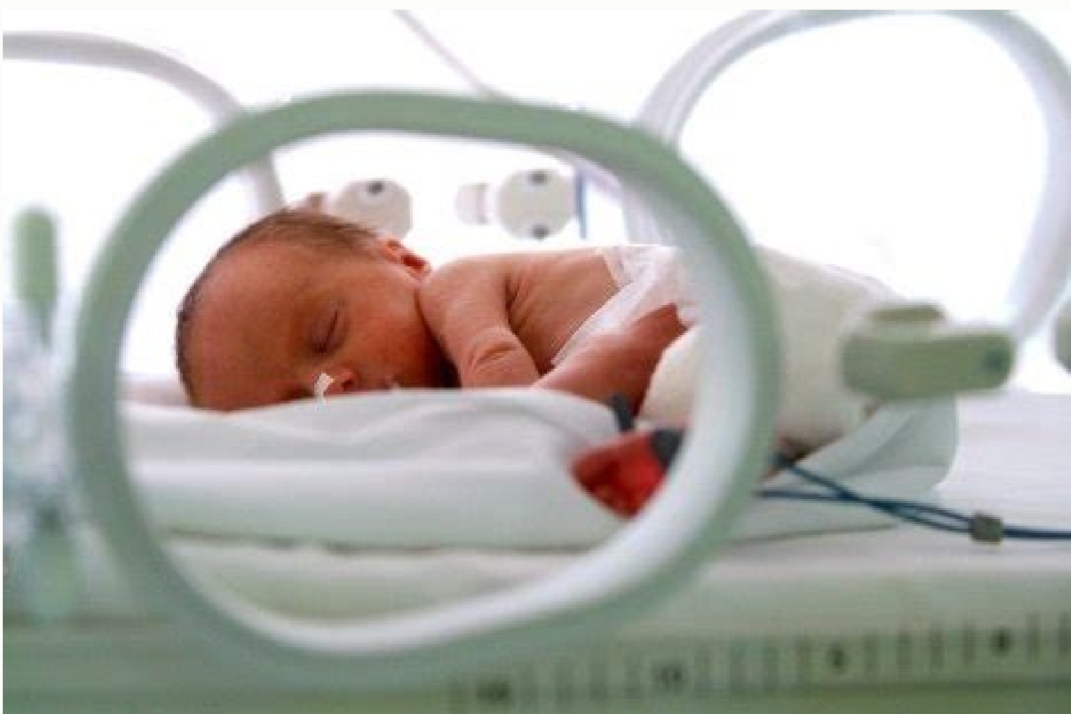
Retinopatía del recién nacido prematuro.